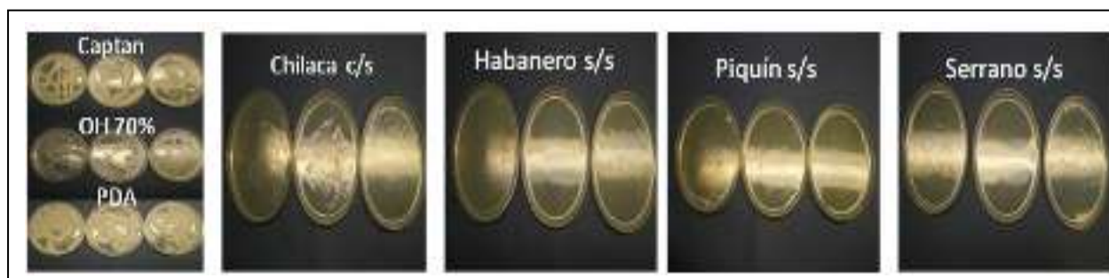
Figura 1. Evaluación de la actividad fungicida de diferentes variedades de chile sobre Botrytis sp. , Fusarium sp. y Alternaria sp. después de cinco días de incubación.