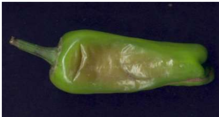
Figura 2. Síntoma característico de la Podredumbre blanda de los frutos o pudrición del fruto en chile de agua.

En la planta la infección de la bacteria inicia por el pedúnculo del fruto de donde emigra a la parte carnososa de la epidermis del chile, para continuar creciendo a lo largo del fruto y si las condiciones ambientales le son favorables en un periodo no mayor a 96 horas, infecta completamente el chile; el cual, se presenta como una masa flácida totalmente acuosa.