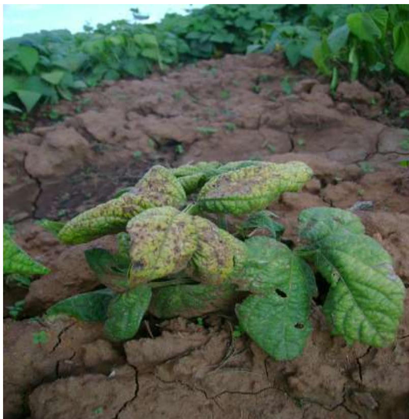
Figura 3. Planta de frijol de la variedad Aluvori mostrando síntomas causados por BMCTV

Recientemente se logró identificar al BMCTV en plantas de la variedad de frijol Aluvori sembradas dentro del Campo Experimental Zacatecas que mostraban achaparramiento, follaje verde amarillento y de consistencia coriacea con poca o ninguna flor o vaina (Figura 3). Lo anterior es importante ya que es una práctica frecuente entre los productores de chile sembrar frijol en los huecos que dejan las plantas de chile que se mueren por efecto de otras enfermedades