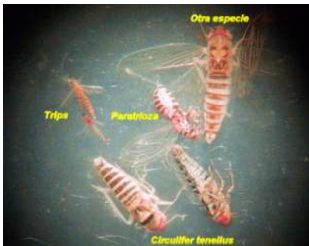
Figura 1. Especímenes de la chicharrita C. tenellus y su comparación con otras plagas comunes en Chile.