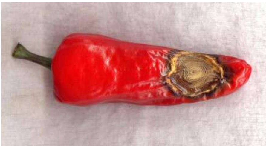
Figura 1. Síntoma característico de la antracnosis o manchado del fruto en chile de agua.

Cuando las condiciones ambientales favorecen el desarrollo del patógeno, la infección se extiende hasta el interior del fruto dañando y contaminando toda la semilla, las semillas afectadas presentan manchas ligeramente hundidas en la testa, de tamaño variable y de color café oscuro; además en el exterior del fruto pueden observarse masas de esporas de C. capsici de color naranja o ligeramente cafés que generalmente forman anillos concéntricos.