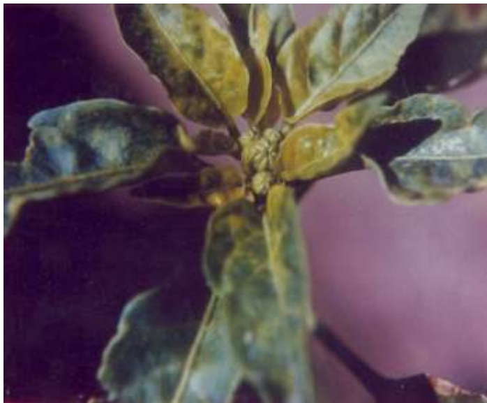
Figura 3. Síntoma característico de la virosis en chile de agua.

Las infecciones por VMT producen frutos con manchas o moteados amarillos, disminución del tamaño y deformaciones generalmente arrugamientos; el VMP se caracteriza porque los frutos pueden presentar deformaciones, disminución del tamaño, alteraciones en forma de manchas de color verde oscuro, maduración irregular y/o dibujos en forma de anillos o en formas de anillos con la piel hundida; en tanto que el VJT generalmente produce deformaciones del fruto; Sin embargo en los lotes de producción de chile lo mas frecuente es la presencia de dos o mas virus dañando los frutos.