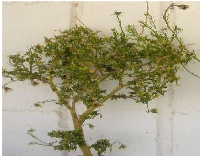
Figura 4. Planta de Eruca sativa mostrando síntomas asociados con los amarillamientos de chile.

El vector de BMCTV prefiere las hospederas aisladas con abundante luz solar para desarrollar sus actividades por lo que es frecuente encontrarlo en malas hierbas aisladas. En Zacatecas se ha identificado alguna maleza con síntomas parecidos a los que desarrollan las plantas de chile infectadas con ese virus: amarillamiento, follaje coriáceo, sin estructuras reproductivas; entre ellas destacan la gualdrilla ( Eruca sativa ), saramao o nabo silvestre ( Reseda luteola ) y la mostacilla ( Sisimbrio spp. ) (Figuras 4 y 5).