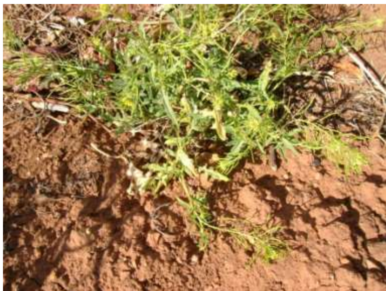
Figura 5. Planta de mostacilla ( Sisimbrio sp. ) con síntomas de amarillamiento.